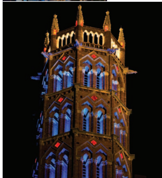
Toulouse, les Jacobins