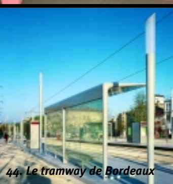
44. Le tramway de Bordeaux