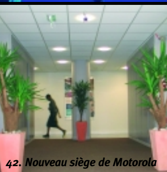
42. Nouveau siège de Motorola