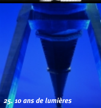
25. 10 ans de lumières