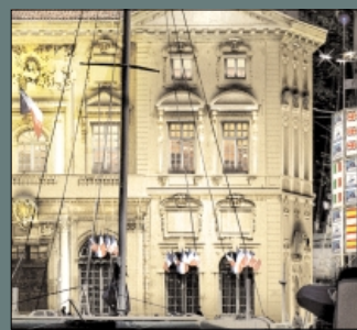
Infographie Alain Guilloth

En couverture Le Mondial 98, c'est dans six mois ! Pour Marseille, c'est déjà aujourd'hui. En effet, le tirage au sort des rencontres s'y tient ce 3 décembre, en présence de 2 500 journalistes. A l'occasion de cet événement, la ville inaugure la 2 e phase de son plan lumière.